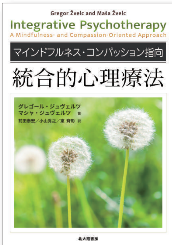
原題: Integrative Psychotherapy: A Mindfulness- and Compassion-Oriented Approach

グレゴール・ジュヴェルツ, マシャ・ジュヴェルツ 著 前田泰宏, 小山秀之, 東 斉彰 訳 A5・352頁・本体 4,200円+税 C3011 ISBN:978-4-7628-3262-8